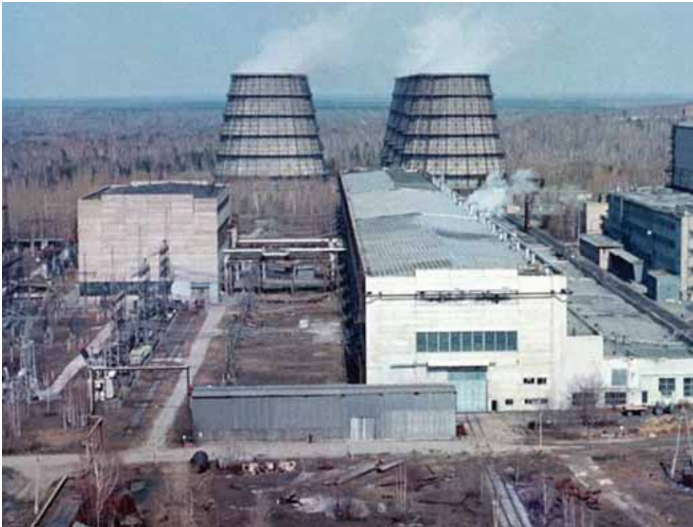
Fot. 1. Siewiersk (Tomsk-7; obwód tomski) – Syberyjski Kombinat Chemiczny

licyno-2), tożsamy z miastem w obwodzie kaliningradzkim, Zielenogorsk (Krasnojarsk-45), przypominający istniejące jeszcze niedawno miasto pod Sankt Petersburgiem, a obecnie stanowiące jego dzielnicę, Mirnyj (z kosmodromem Plesieck), które jest imiennikiem miasta w Jakucji, znanego z wydobycia diamentów, Radużnyj (Władimir-30), odpowiadający miastu w Chanty-Mansyjskim Obwodzie Autonomicznym, znanemu z wydobycia ropy naftowej. Swoje pary mają również Znamieńsk (odpowiednik w obwodzie kaliningradzkim), Zariecznyj (odpowiednik w obwodzie swierdłowskim), Żelieznogorsk (fot. 2 na s. 24 – odpowiednik w obwodzie kurskim i Żelieznogorsk Ilimski w obwodzie irkuckim). Bliskimi krewnymi są również takie osiedla, jak Pierwomajski, Kiedrowyj, Gornyj, Swobodnyj, które mają dziesiątki odpowiedników w otwartych miejscowościach.