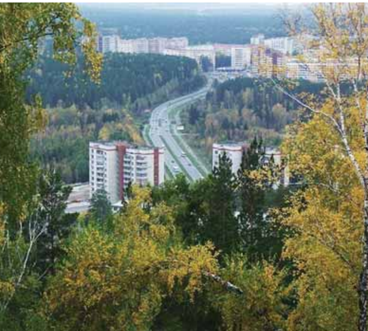
Fot. 2. Żelieznogorsk (Krasnojarsk-45; Kraj Krasnojarski) – widok ogólny na „ukryte” miasto, liczące prawie 70 tys. mieszkańców